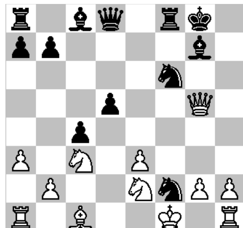
Diagram 2: Aad van Sas – Perry v/d Meer Stelling na 15. ... - Pxf2

Even later ging Perry volop in de aanval met 15. ... - Pxf2 (zie diagram 2 ).