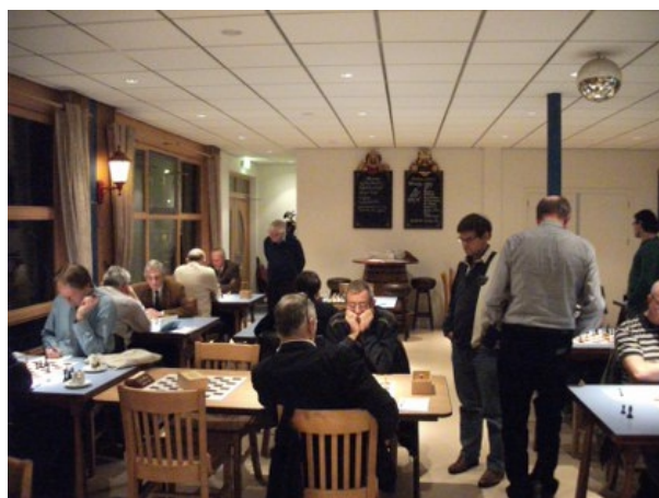
De speelzaal tijdens de interne én externe op 4 december