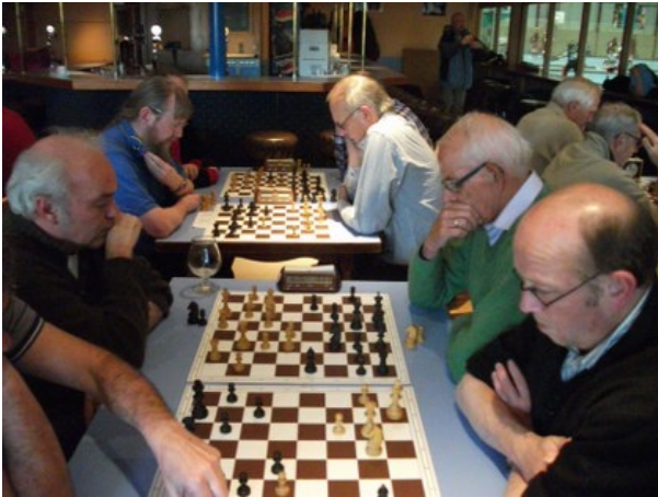
Pomar in actie tegen de uiteindelijke winnaar van groep B, SHTV 1