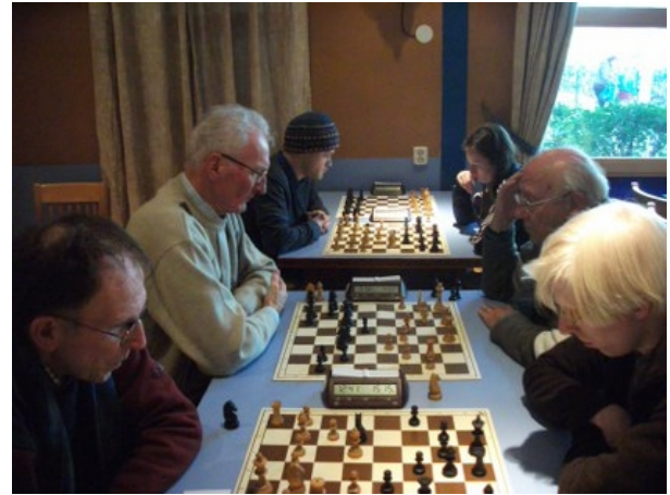
De dames en heren van Haeghe Ooievaar 4 (hier rechts in actie tegen HSV 3) hadden het niet makkelijk en moesten genoegen nemen met de vierde plaats in groep D

De strijd om de tweede plaats was hier zeer spannend en werd uitgevochten door de teams van HSV 2 en HSV 3. Bij het ingaan van de laatste ronde stond HSV 2 één matchpunt voor op hun clubgenoten maar zij moesten in de laatste ronde tegen 'De Mannekes' terwijl HSV 3 het op papier makkelijker had tegen Haeghe Ooievaar 4. HSV 3 won inderdaad, maar HSV 2 sleepte er een gelijkspel uit zodat het tweede team van HSV op bordpunten de tweede plaats pakte in groep D.