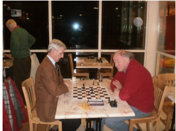
Na het officiële gedeelte nog even na-schaken: sommigen krijgen er nooit genoeg van...