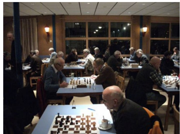
Volle bak tijdens de interne én externe competitie op 8 januari