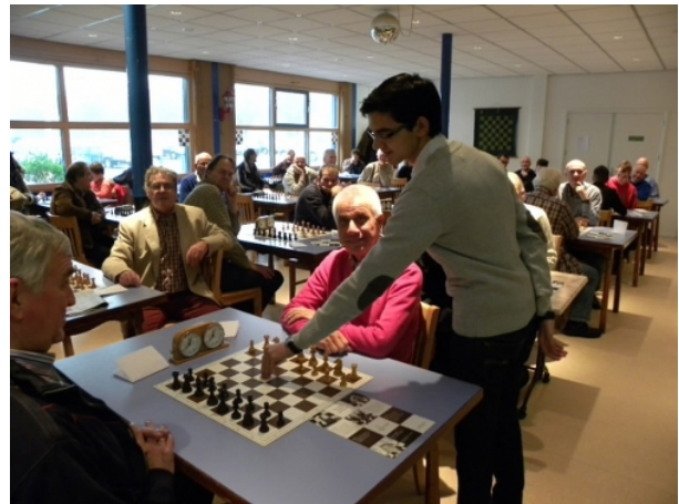
Anish Giri opent het 48e Pomartoernooi dat op 7 december 2013 in De Schilp in Rijswijk werd gehouden

Afgelopen zaterdag, 7 december , vond de 48 e editie van het traditionele Pomartoernooi plaats. Het aantal deelnemers viel wat tegen (40) maar het was weer zeer gezellig. Lothar van der Sluijs (DD) was niet te stuiten en pakte de eerste plaats met de perfecte score van 7 uit 7. Het toernooi kende een feestelijk tintje doordat Anish Giri, Nederlands sterkste schaker op dit moment én inwoner van Rijswijk, het toernooi opende.