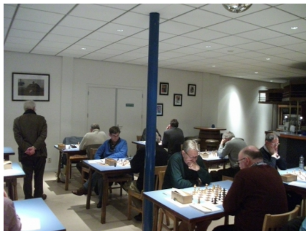
Een deel van de speelzaal tijdens de interne op 28 januari