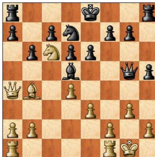
Stelling na 14. ... - h5

is aan de dekking van dit paard: terwijl de dame hard nodig is voor de verdediging van de koning. Bovendien is de zwarte loper ijzersterk en mist wit zijn witveldige loper. Wim speelde hier 15. h4 om 15. ... - h4 van zwart tegen te gaan. Maar misschien is 15. Ld2 gevolgd door f3 een beter plan om de lijn van de zwarte loper te sluiten.